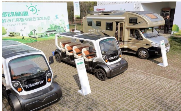
与电动观光车制造商苏州益高有限公司共同开发太阳能全动力观光车