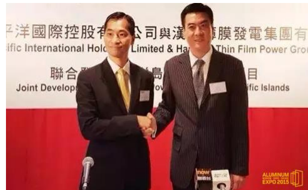
与博华太平洋(1076.HK)就共同发展太平洋地区岛屿薄膜发电项目签订谅解备忘录