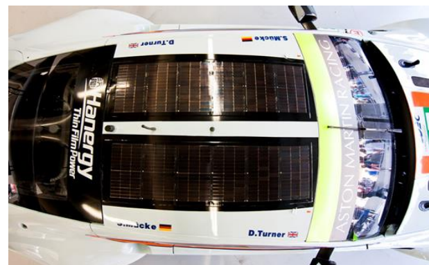
与阿斯顿马丁达成(Aston Martin)汽车应用之合作协议