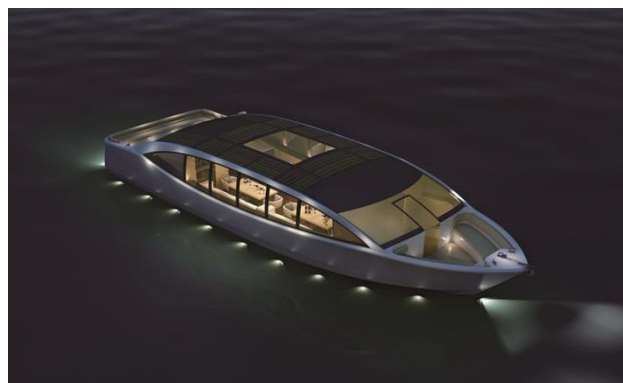
与游艇制造企业毅宏联手研发的节能环保游艇亮相第二十届上海国际游艇展